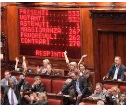
Una delle 82 volte in cui il governo è stato battuto

governo che non esistono più, ma che vanno avanti senza vergogna a danno di tutti gli italiani. Un anno di battaglie dall'opposizione per affermare l'alternativa, per dare speranza e futuro al nostro Paese. Quello del gruppo del Partito democratico della Camera è stato un impegno profondo e determinato per sostenere il cambiamento. In queste pagine, giorno per giorno, provvedimento per provvedimento.